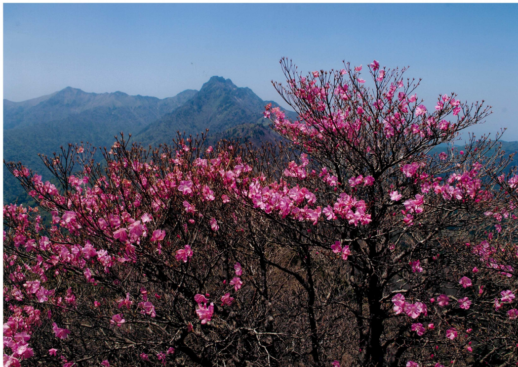
作品名：石鎚山とアケボノツツジ（撮影場所：愛媛県久万高原町）