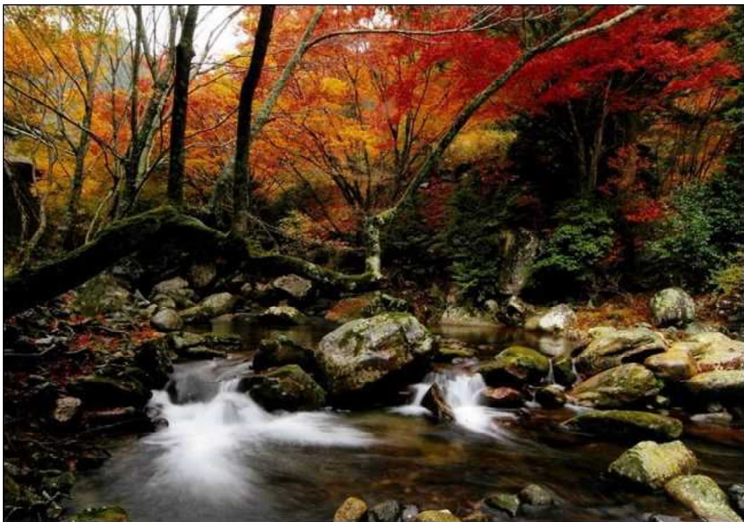
作品名：刻を流す（撮影場所：愛媛県松野町）